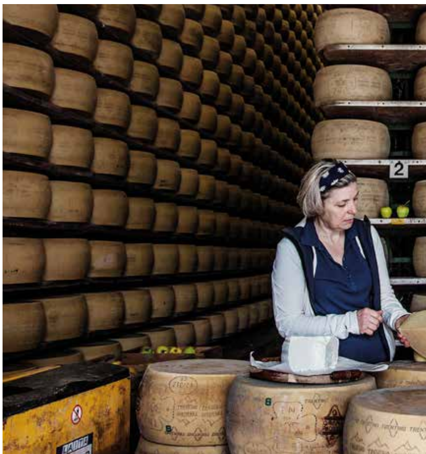
Powyżej: szef kuchni w Locanda Alpina w Val di Non do swoich dań dobiera ser Trentingrana. Obok: szef kuchni w Malga Panna.